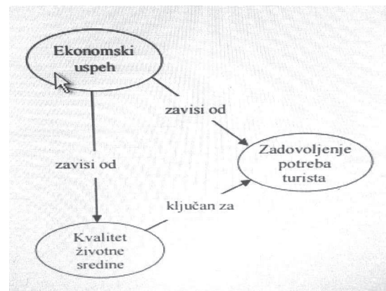
Slika 1. Relacija između ekonomskih efekata u turizmu

Jedna od ključnih funkcija turizma jeste da daje ekonomsku vrijednost prirodi. Alternativni tipovi turizma, kao što je ekološki turizam, još više naglašavaju centralno mjesto koje priroda ima u aktivnostima turista. Kako je navedeno, postoji direktna relacija između ekonomskih efekata u turizmu, životne sredine i zadovoljstva turista (slika 1).