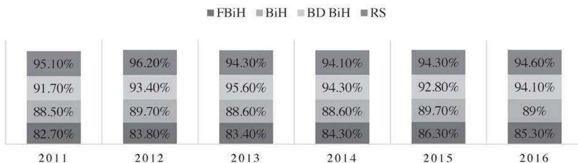
Grafikon 3. Učešće prihoda od poreza na dohodak, dobit i kapitalnu dobit u direktnim poreskim prihodima Bosne i Hercegovine, Republike Srpske, Federacije BiH i Brčko Distrikta BiH