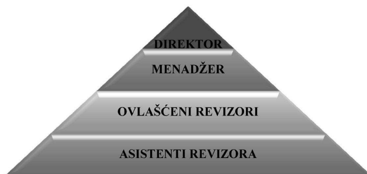
Slika 1. Organizaciona šema revizorske firme 1

Direktori su obično vlasnici revizorskog društva. Oni su bitno uključeni u planiranje revizije, određivanje obima revizije, procjenu rezultata, rješavanje praktičnih problema, određivanje revizorskog mišljenja, prisustvovanje skupštini akcionara kako bi mogli da odgovore na pitanja u vezi s finansijskim izvještajima i izvještajima revizije. Direktor je osoba koja mora donijeti konačnu odluku, uključujući i najsloženija mišljenja.