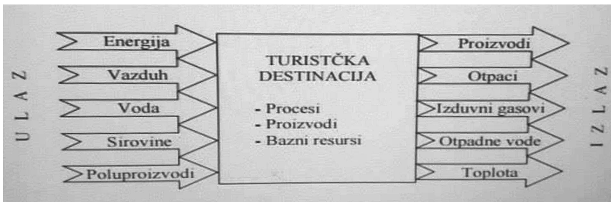
Slika 3. Ekološki bilans turističke destinacije

Na slici 3. prikazana je šema ekološkog bilansa turističke destinacije, koja je u velikoj mjeri pojednostavljena i uopštena. Iz prikazane ilustracije se vidi da se unutar turističke destinacije odvijaju određeni procesi usmjereni ka zadovoljenju zahtjeva turista, a takođe se, iz istih razloga, proizvode različiti proizvodi. Pri tome se koriste kako resursi koji predstavljaju imovinu destinacije tako i prirodni resursi koji se nalaze unutar nje. Za odvijanje procesa i za proizvodnju proizvoda koriste se: energija, vazduh, voda, sirovine i poluproizvodi. To sve predstavlja ulaz u destinaciju koji treba da bude kvantitativno bilansiran. Kao izlaz se identifikuju: proizvodi, otpaci, izdurni gasovi, otpadne vode i emitovana toplota.