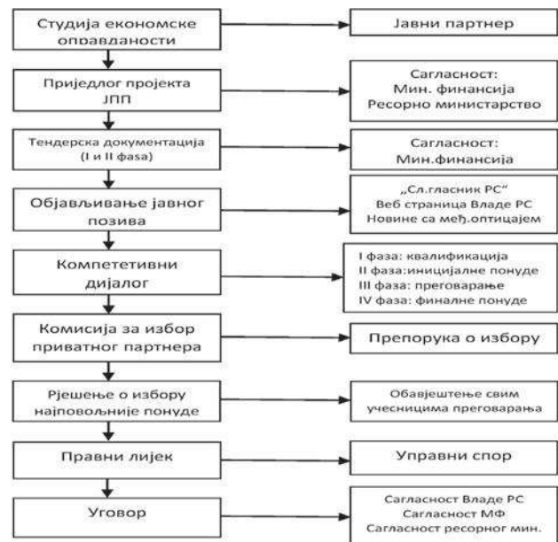
Šema 3. Procedura izbora privatnog partnera