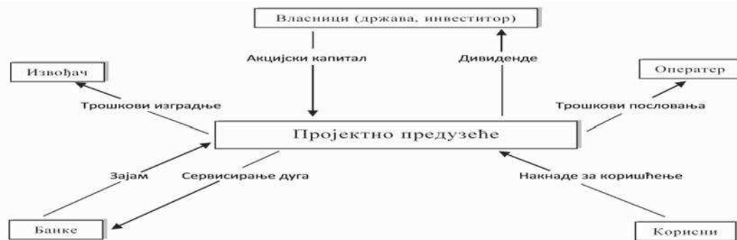
Šema 2. Akteri institucionalizovanog JPP

Oblici JPP variraju od običnih ugovora o projektovanju i izgradnji, preko tzv. modela „design–build–operate–transfer“ („projektuj–izradi–koristi–prodaj“), pa sve do složenih ugovora o koncesiji. Kod klasičnog institucionalizovanog JPP postoji šest aktera. Projektno preduzeće je u središtu usluge. Početni kapital u kompaniju ulažu vlasnici. Oni zauzvrat očekuju neku vrstu dividende, bilo u gotovini, bilo u formi subvencionisanih usluga. Projektno preduzeće može pribavljati sredstva na tržištu, na primjer, putem zaduživanja kod banaka, kojim projektno preduzeće servisira dug. Prilikom izgradnje nekog objekta projektno preduzeće kao investitor zaključuje ugovor sa građevinskim preduzećem (izvođačem radova), čiji se troškovi isplaćuju iz ostvarenih prihoda. Formira se operativno tijelo, bilo u okviru projektnog preduzeća bilo kao posebni pravni subjekt, koje dobija naknadu za svoje troškove poslovanja. Finansijsku osnovu svih ovih tokova kapitala čini korisnik usluge, koji plaća naknadu ili na drugi način finansijski doprinosi (Peteri, 2010). Navedeni akteri i novčani tok u JPP prikazan je na donjoj slici (šemi).